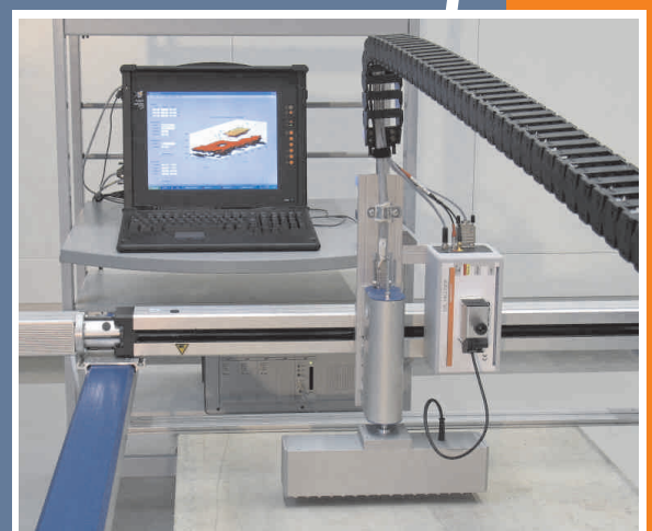
Komponenten Flexus Beton: Ultraschallprüfgerät, Prüfkopf-Array, Multiplexer, Scanner mit Steuerung

Eine kundenspezifische Anpassung des Abbildungssystems ist möglich.