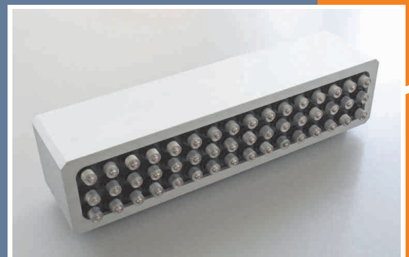
Prüfkopf-Array mit 48 Elementen